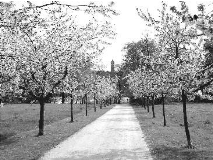
Kirschblüte auf den Havelmathen 2007

Im selben Jahr begannen die Entwicklungsmaßnahmen für das Landschaftsschutzgebiet. Dazu gehörte die Räumung des Campingplatzes sowie die Umsetzung von Kleingärten. Das damalige Gartenbauamt betrieb die Erweiterung der „Großen Badewiese“ und den Neubau der Grünanlage am Kladower Damm.