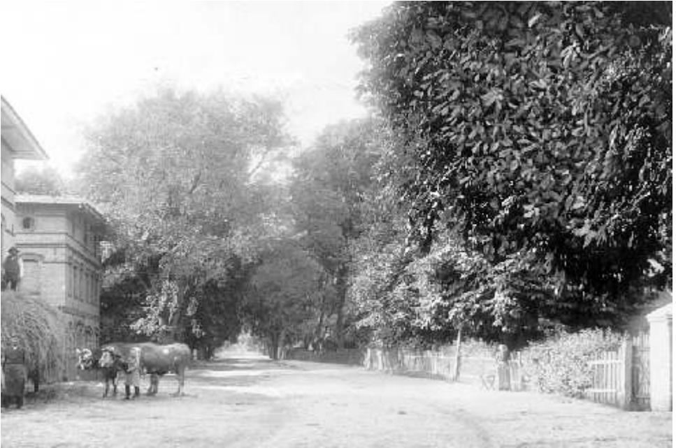
Stall / Scheune des Gutshauses Buchwaldzeile

Von der Buchwaldzeile führt ein kleiner Weg in Richtung Westen auf den Windmühlenberg. Verfolgt man diesen Weg, so wird man auf der linken Seite noch Reste eines Wasserturms entdecken, der auch ursprünglich zur Gutsanlage gehörte. Wieder zur Buchwaldzeile zurückgekehrt, sieht man gegenüber dem ehemaligen