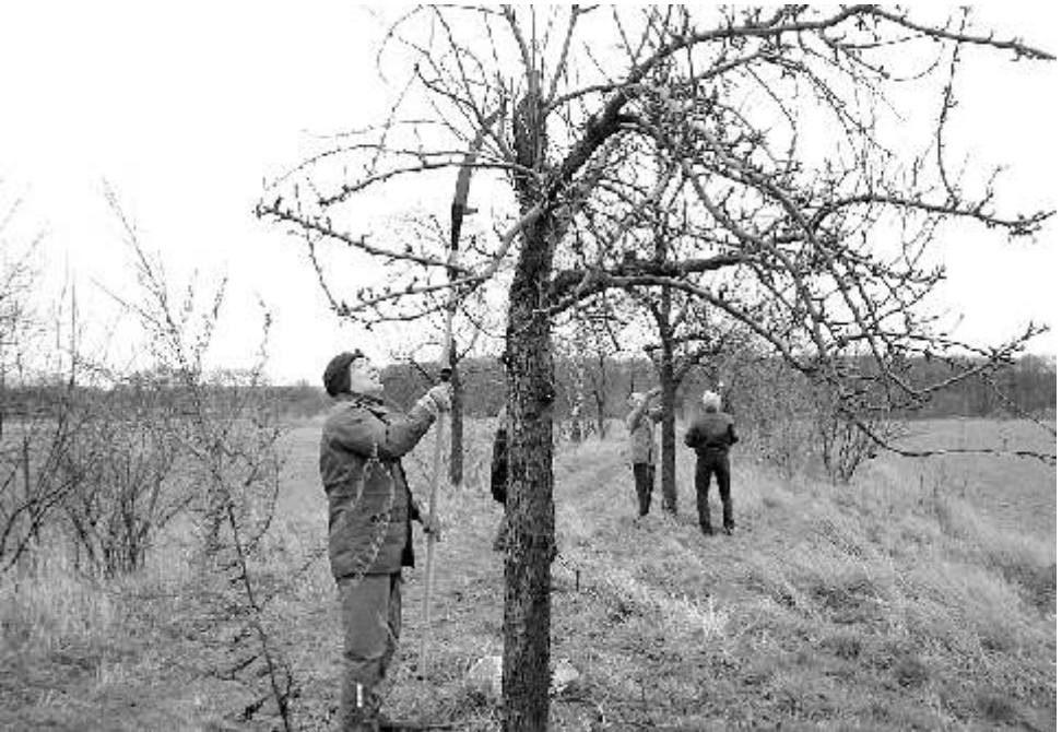
AK Gatow / Baumpflege auf den Riesefeldern 2007

Bis zum Ende des folgenden Jahres war die Idee zu einem gut durchdachten Konzept gereift. Auch war ein ideales, 800 qm großes städtisches Grundstück am Rand der Feldflur gefunden worden, das der Pächter seitdem zur Verfügung stellt. Von der Revierförsterei mit Umzäunung und Toren versehen, wurde die Baumschule zum Erntedankfest 1988 durchaus angemessen eingeweiht: Im Sommer hatte der Arbeitskreis den Europäischen Umweltpreis für Naturschutz erhalten.