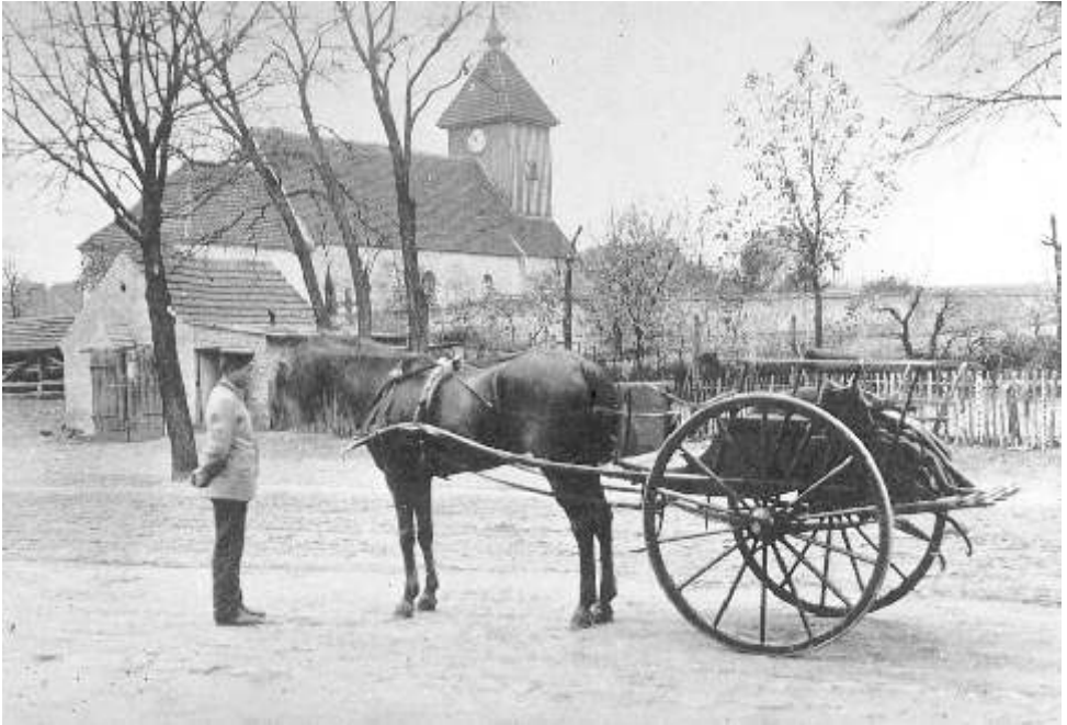
Der erste Pferdewagen (Dogcart), auf dem auch die Kaiserliche Spritze transportiert wurde. Im Hintergrund, vor der Kirche, der erste Geräteschuppen der Gatower Feuerwehr.

12.01.1913 Schneidermeister Wichmann erhält für die Reparatur der Feuerwehrranzüge aus der Gemeindekasse 57,40 Mark.