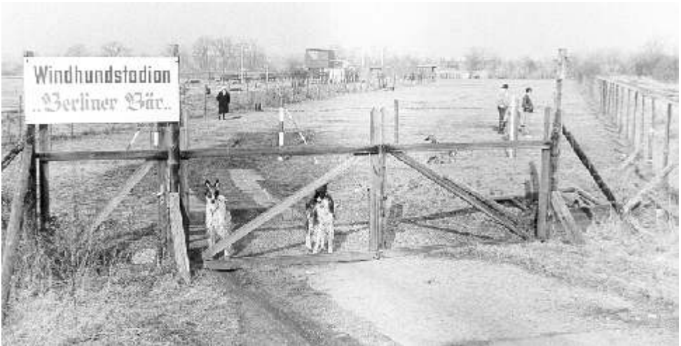
Windhund-Verein auf der Fläche G der Rieselfelder

Dort lagen die Absatzbecken und die Filteranlagen, in die das ungeklärte Wasser durch eine Druckleitung gepumpt wurde. Von dort aus leitete man das mechanisch vorgeklärte Wasser, das natürliche Gefälle ausnutzend, durch die Zulaufgräben auf die dafür vorgesehenen tiefer gelegenen, terrassenartig angelegten Schläge.