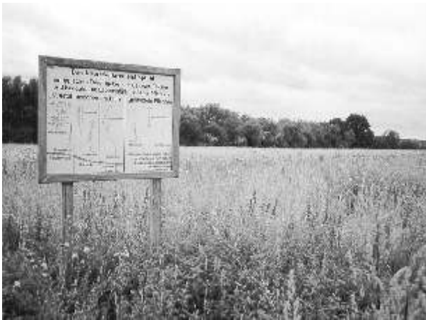
Hier der letzte von vieren: der Hüllenpfuhl

Die Flächen der einst landschaftsprägenden feuchten Niederungen wurden damit drastisch verkleinert. Zuletzt war von den vier Pfuhlen nur der Hüllenpfuhl übrig geblieben, der ab 1970 mit Abfällen und Bodenmaterial aufgefüllt wurde. Um eine weitere Verunstaltung zu verhindern, wurde er 1975 als flächenhaftes Naturdenkmal geschützt.