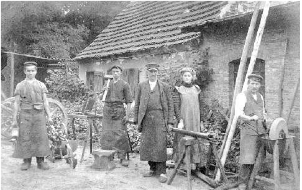
Schmiede Zschalig (Standort Villa Lemm)