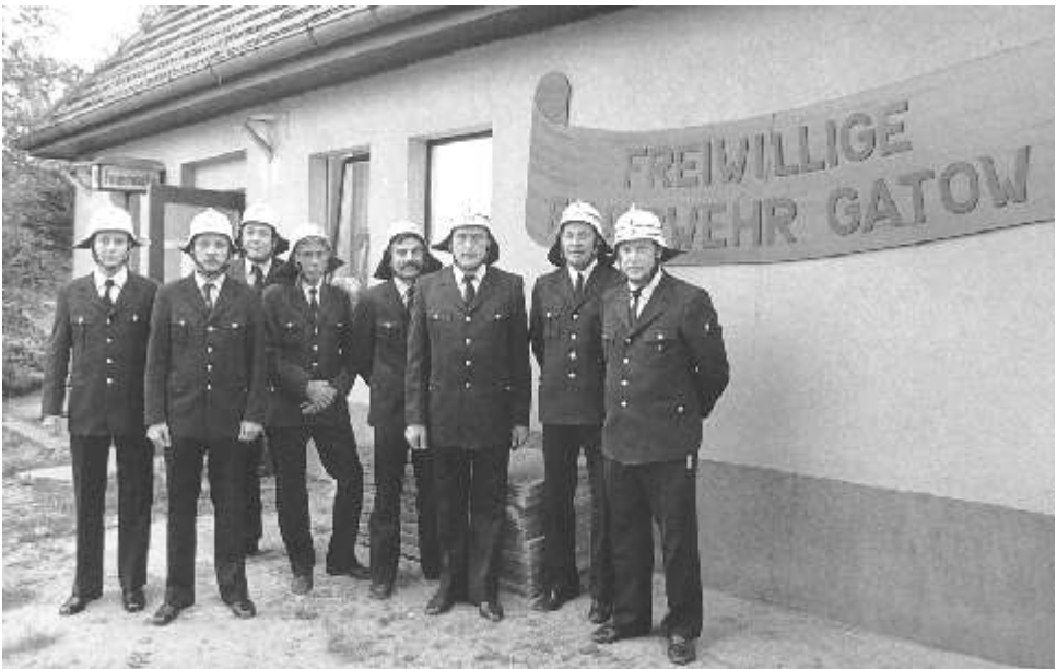
Freiwillige Feuerwehr Gatow (1989)

Im Dezember 1912 erfolgte der Beitritt zur Brandenburgischen Feuerwehr. Anschließend, im Januar 1913, wurde einstimmig beschlossen, auch der Unfallkasse beizutreten, damit sich die Unfallfürsorge auf sämtliche löschdienstpflichtigen Personen der Gemeinde erstreckte.