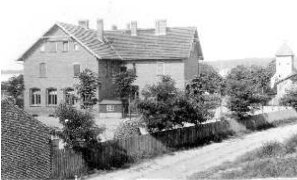
Das alte Schulgebäude, im Hintergrund rechts die Kirche

Für das Jahr 1907 werden die Unterhaltskosten einschließlich der Gehälter für Lehrer (mit Küsterzulage) mit knapp 4300 Mark angegeben.