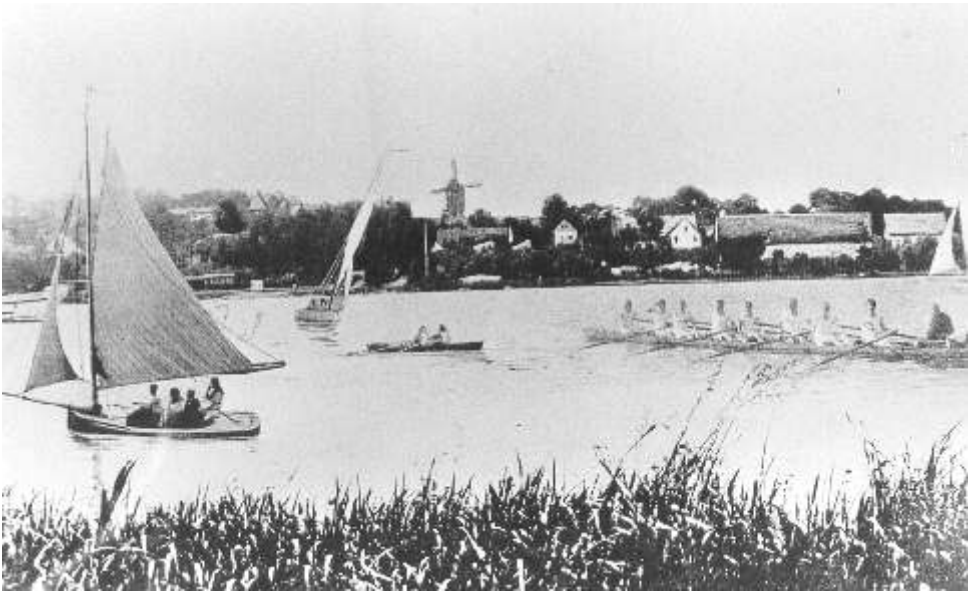
Blick auf Gatow. Im Hintergrund ist die Gatower Windmühle zu sehen.

Das Dorf Gatow blieb in seiner Kernstruktur bis in die Nachkriegszeit im Wesentlichen erhalten. Erst danach setzten die starken baulichen Veränderungen ein. Trotz dieser z.T. rigorosen Veränderung des Dorf-Erscheinungsbildes sind wesentliche Strukturmerkmale erhalten geblieben. Dazu gehört die dominierende Lage der Kirche inmitten des Dorfes, sowie noch einige Bauernhöfe, die einen guten Einblick in die Struktur eines märkischen Hofes gewähren.