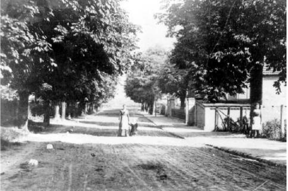
“Dorfstraße” Alt-Gatow (um 1914)

Das Dorf Gatow und seine Gemarkung dürften während der ersten großen Besiedlungsphase der „Ostkolonisation“ unter den Askaniern um 1200 angelegt worden sein. Die erste urkundliche Erwähnung des Ortes ist allerdings erst 1258 überliefert. Die typische Dorfform dieser mittelalterlichen planmäßigen Besiedlung ist in der Regel das große Anger- oder Straßendorf. Gatow ist eine Sonderform, ein schmales, einzeiliges Straßendorf. Das bedeutet, dass alle Bauernstellen nur auf der