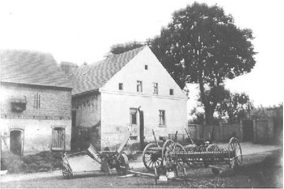
Hof Wolter mit Wasserpumpe