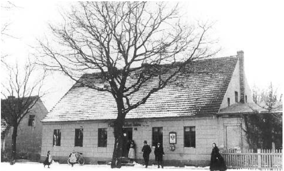
Das "alte" Wirtshaus Gatow (vor 1903)

Auf Befehl des Königs, Friedrich II., mußten preußische Bauern in ihren Gärten fünf Obstbäume und vor ihrem Hof fünf Laubbäume pflanzen. Auch der Kirchenpatron und Gutsherr von Dallgow (der auch für Gatow zuständig war) hat um diese Zeit - wohl inspiriert vom Erlass seines Königs - eine „Bauernordnung“ erlassen, die auch für Gatow gelten haben dürfte.