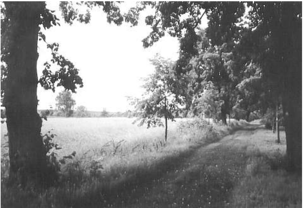
Die Lindenallee neben dem Landschaftsfriedhof in der Nähe der ehemaligen Schlammeponie (Positionen 08 und 06 in der separaten Wanderkarte)

Dankbar können wir feststellen, dass die Fläche G wieder Teil der vielfältigen Gatower Landschaft geworden ist, die einerseits im Norden geprägt wird durch die Kleinteiligkeit der Rieselfelder, andererseits durch die weitläufigen Äcker, Wiesen und Hecken der Feldflur sowie den daran im Süden angrenzenden Wald. Überzeugen Sie sich davon!