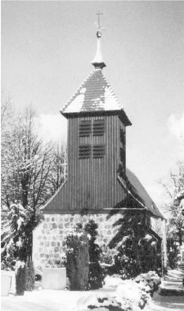
Die Gatower Kirche nach der Restaurierung von 1953