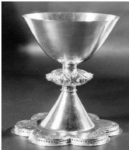
Abendmahlkelch (Gatower Kirche)