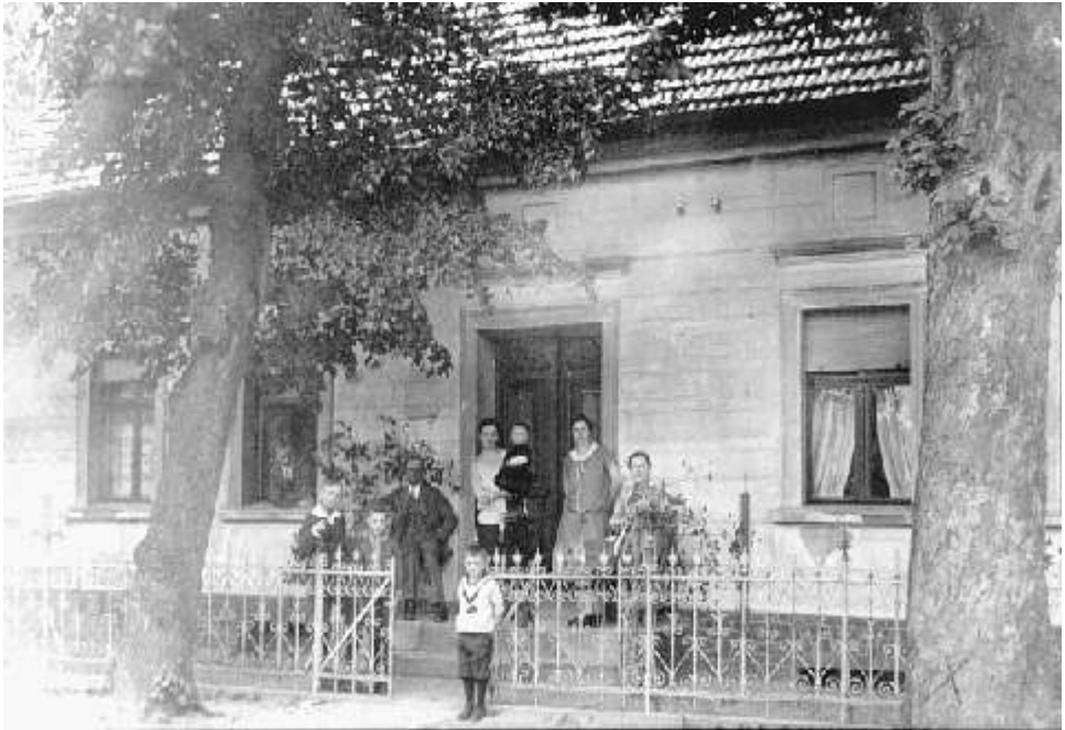
Wolters Bauernhof (um 1904)

Von Anfang an haben Bauern den Ort geprägt. Schon 1375 sind 50 bewirtschaftete Hufen urkundlich belegt, im Jahr 1450 sogar 62. Von 1590 und 1624 genannten