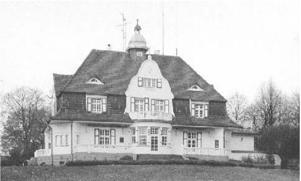
Villa Lemm / Rothenbücherweg, erbaut 1916 / 1918

Otto Lemm, ein Berliner Schuhputzmittelfabrikant, ließ sich auf einem Teil seines Grundstückes, das zu dieser Zeit bis zur Haveldüne reichte, 1907/1908 vom Architekten Max Werner eine prachtvolle Villa im englischen Landhausstil erbauen.