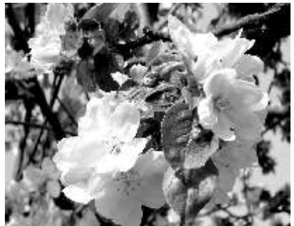
“Unsere” Obstbaumblüte 2007