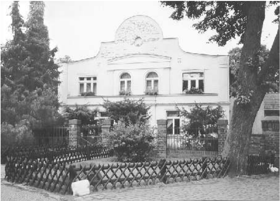
Alt Gatow 65 / Beutelsches Gut

dert. Auf diesem Hof befindet sich auch das älteste Zeugnis ländlicher Volksarchitektur in Gatow: Ein kleines Stallgebäude aus Lehmfachwerk. Zum Schutz vor weiterem Verfall wurde es Mitte der 80er Jahre „verbrettert“. Seine Entstehung wird auf 1770/80 geschätzt. Laut „Gebäudebeschreibungen“ des Spandauer Vermessungsamtes von 1892 bestand dieser Stall aus Fachwerk und wies zwei Stockwerke auf. Er war mit Rohr gedeckt und bot Raum für eine Rolle (Wäschemangel), die Baukammer, eine Wagenremise und den Kornboden. Dieses Gebäude wurde 2004 bis 2006 mit alter Handwerkskunst aufwändig restauriert und dient seitdem als touristisch attraktives „Dorfmuseum“. Nach Erzählungen der letzten Besitzerin, der Witwe Beutel, muss es auf dem Hof des früheren Bürgermeisters von Gatow fröhliche Waschtage gegeben haben: Um seiner Frau und den Wäscherinnen die Arbeit zu versüßen, engagierte Beutel immer einen Drehorgelspieler.