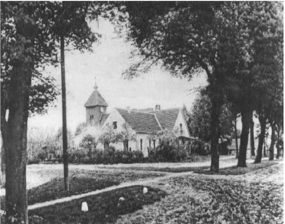
Gatow - Dorfstraße mit Blick auf die Kirche (vor 1925)

WIR WÜNSCHEN IHNEN VIEL SPASS BEI IHRER ERKUNDUNGSTOUR DURCH DAS DORF GATOW UND SEINE UMGEBUNG!