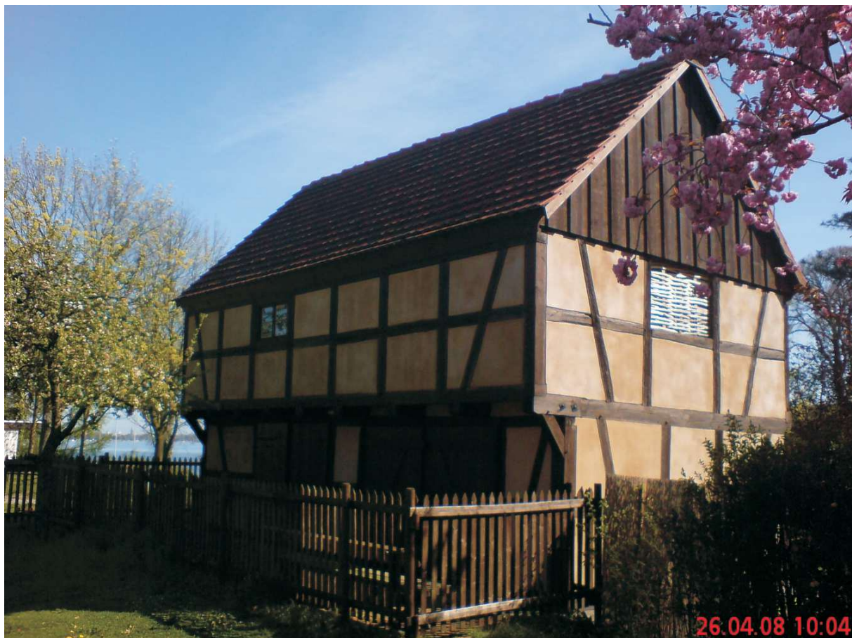
Der restaurierte Kornspeicher direkt am Parkplatz oberhalb der "kleinen Badewiese"

Der alte Kornspeicher allerdings blieb. Als er dann am Ende des letzten Jahrhunderts arg baufällig wurde und einzustürzen drohte, übernahm ihn der Förderverein historisches Gatow und restaurierte ihn zusammen mit der Knobesldorff-Schule für Bauberufe. Seit 2006 steht er wieder im alten Glanz auf dem Beutel-Hof.