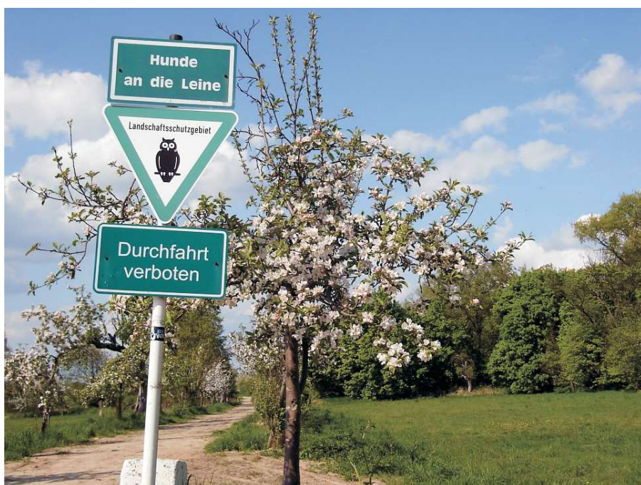
Landschaftsschutzgebiet Rieselfelder Karolinenhöhe

Dieser umfangreiche Vorschlag basierte auf Ideen für ein "Freilandlabor Karolinenhöhe", welche vom AK Gatow in die Diskussion gebracht worden waren. Das BA Spandau lehnte es ab, sich mit diesem Vorschlag zu beschäftigen, geschweige denn ihn zu prüfen oder ihm zuzustimmen.