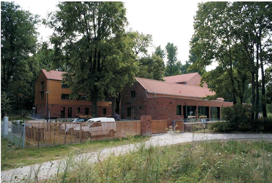
Das neue Umwelt-Bildungszentrum, Kladower Damm 55-57

Im September 2014 wurde das Umweltbildungszentrum eröffnet, in dem Köche und Hotelfachkräfte ausgebildet werden. In dem Gebäude gibt es Übernachtungsräume für Seminarteilnehmer, Seminar- und Ausstellungsräume sowie eine Cafeteria, die auch hausfremden Besuchern offensteht. Ein Kräuternutzgarten wird die Lehrküche mit frischen Kräutern versorgen. Das Haus soll auch Gatower Bürgern für Veranstaltungen zu Verfügung stehen.