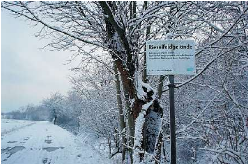
Die geschützten Rieselfeldflächen im Winterkleid

Seit den wissenschaftlichen Gutachten der TU Dresden aus den Jahren 1988 / 90 war bekannt, dass der Rieselfeldbetrieb das Grundwasser beeinflusst. Deshalb wurde zur Immobilisierung der seit rund 100 Jahren im Boden angereicherten Schadstoffe "Mischwasser", seit 1997 "Klarwasser" aus dem Klärwerk Ruhleben in den