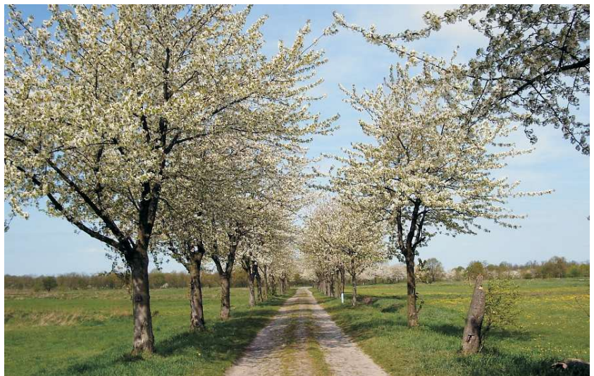
Kirschblüte auf den Rieselfeldern

von den Pachtflächen abhing? Wie hoch wäre der Kaufpreis gewesen? Es war von 0,80 € / m 2 und 2-3 Mio € insgesamt die Rede - ein "Schnäppchen"! Immerhin handelt es sich um eine Fläche von rund 300 ha, größer als der Große Tiergarten!