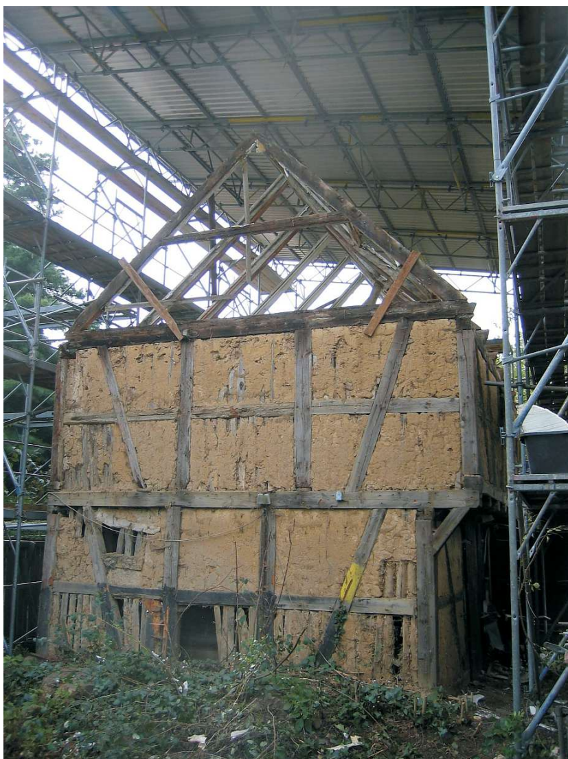
Der Alte Kornspeicher vor der Renovierung 2006

In der Mitte des Dorfes, gleich neben dem Lehenschulzen-Gut (heute Parkplatz der "Kleinen Badewiese") befand, und befindet sich immer noch, der Hof der Familie Beutel. Es war ursprünglich kein großer Hof, sondern mehr eine Büdnerstelle. Im Gegensatz zu den Vollbauern oder Hufnern, die in Gatow zwischen 40 Morgen und 100 Morgen Land besaßen, hatte ein Büdner nur eine kleine Fläche zur Verfügung. Auf dem Büdnerhof war auch, im Gegensatz zu den Höfen der Vollbauern, der Stall für das Vieh direkt an das Wohnhaus angebaut.