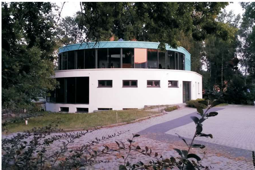
Das neue Vereinshaus des Paddel-Clubs in Gatow

Doch Ende der neunziger Jahre erreichten den Paddel - Club Wiking für seine weitere Existenz bedrohlich klingende Informationen: Für den geplanten Ausbau der Havelwasserstraße müsse die Freybrücke angehoben und wegen Altersschäden an der Bausubstanz am besten gleich ganz abgerissen und durch einen Brückenneubau ersetzt werden. Hierfür werde aber - alternativlos - das dem Paddel - Club gehörende Grundstück Mahnkopfweg 2 benötigt, über das während der Bauzeit mehrere Jahre lang der Verkehr mit Hilfe einer Behelfsbrücke umgeleitet werden müsse.