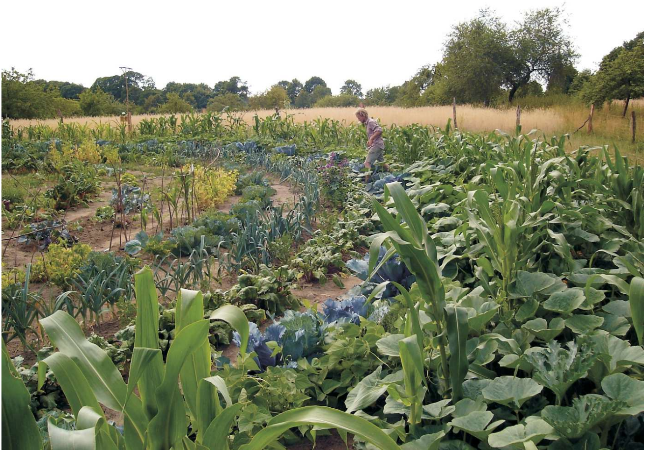
Ein Teil eines "Bauerngarten"-Kreises : Urbane biologische Landwirtschaft auf Havelmathen

In dem Projekt "Bauerngarten" von Max von Grafenstein können Interessenten eine tortenstückförmige Parzelle aus einer kreisrunden Gartenanlage für einen Jahresbeitrag buchen. Sie übernehmen im Frühjahr das Gartenstück mit eingearbeitetem Saatgut für Gemüse, Kräuter und Blumen und besorgen selbst die gärtnerische Pflege der Feldfrüchte sowie die Ernte. Der Verpächter garantiert eine zuverlässige Bewässerung und die fachgerechte Düngung und bietet darüber hinaus fachliche Beratung und Betreuung an.