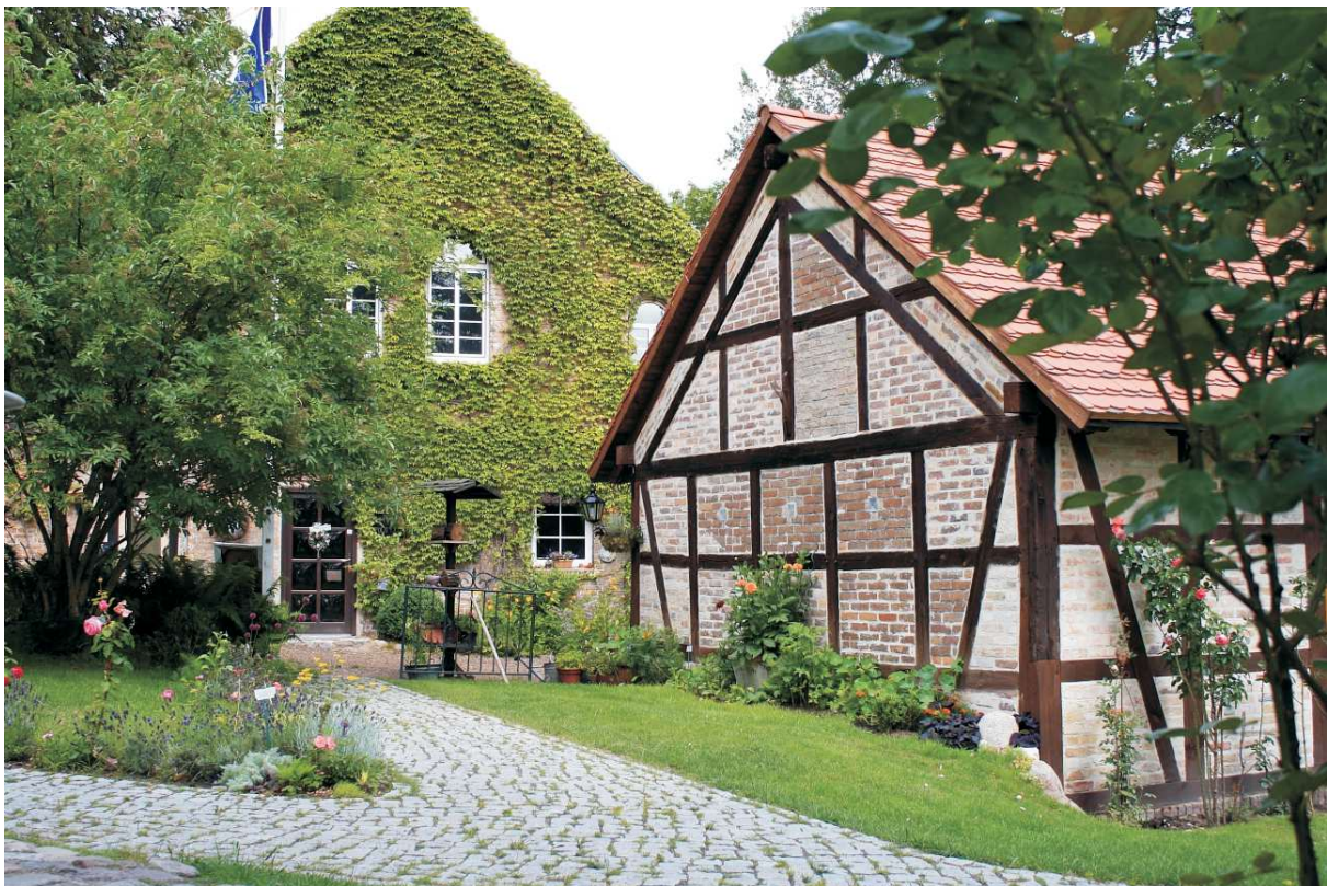
Das Gutshofgelände mit der restaurierten Remise im Vordergrund

Ab November 1989 nahmen die Pferdebesitzer die Chancen im Umland für den Pferdesport wahr und die Stallunterbringung von Pferden als Gewerbebezug fiel teilweise ab dem Jahr 2010 weg.