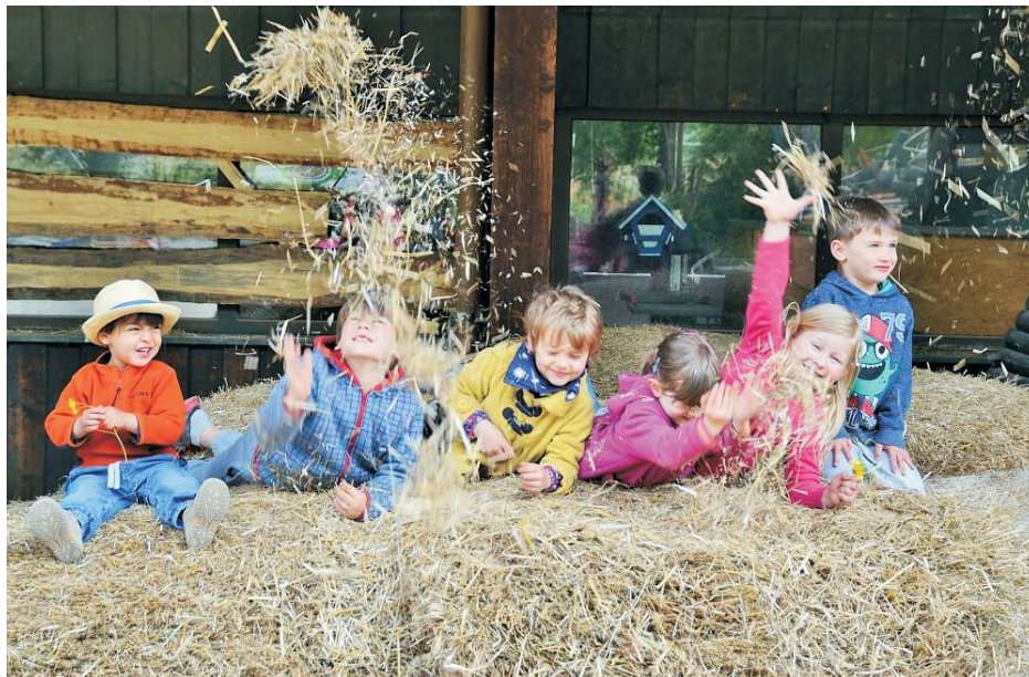
Kinder erleben Natur auf dem Bauernhof.

Die gemeinnützige Vierfelderhof GmbH versteht sich als Familien- und Kinder-