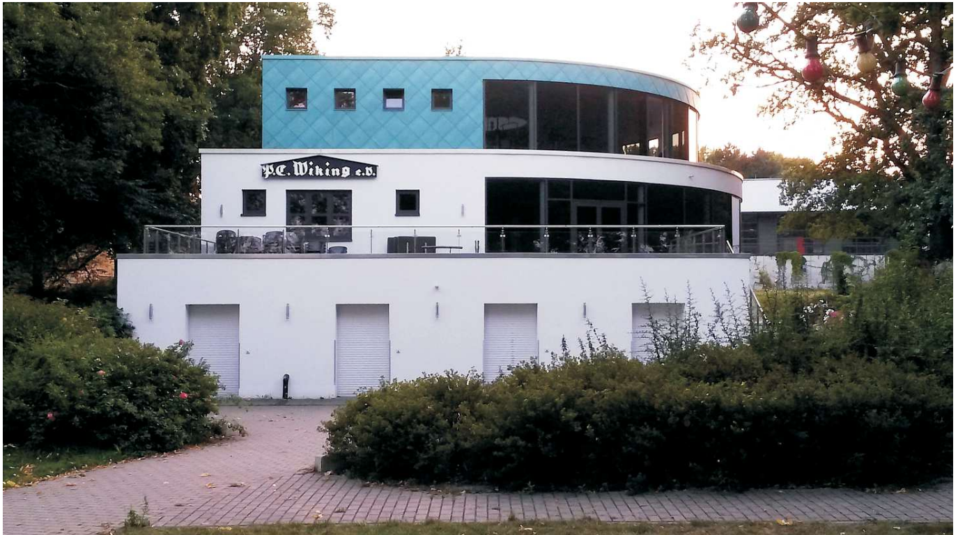
Das neue Vereinshaus des Paddelclub Wiking von der Wasserseite aus gesehen mit direktem Zugang zum Ufer der Unterhavel.

Grundstücks Gatower Straße 333 an. Der andere, vordere Teil dieses über 2500 Quadratmeter großen Grundstücks ist dann von vornherein für ein dringend benötigtes neues Gebäude der Freiwilligen Feuerwehr Gatow reserviert worden. Ein Jugendclub, der dort bis dahin in überholungsbedürftigen Gebäuden angesiedelt war, sollte ohnehin umgesiedelt werden.