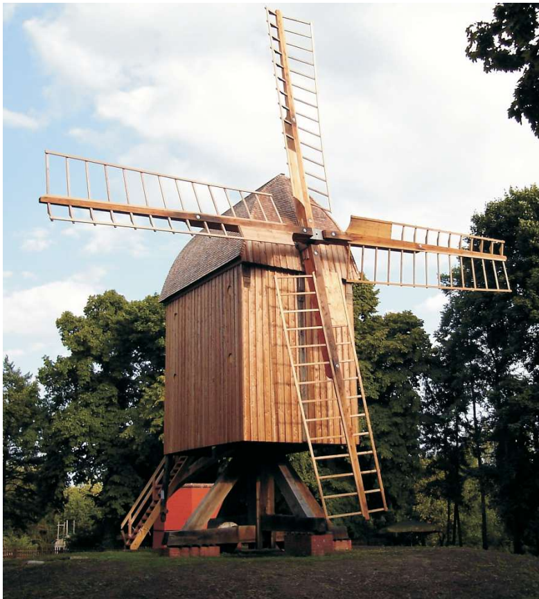
Die bis 2008 neu errichtete Gatower Bockwindmühle

Auf alten Bildern steht die Mühle, die dem Bäcker in Gatow gehörte, noch auf dem Windmühlenberg. Er verkaufte sie an eine Filmfirma, wo der Regisseur, dem Drehbuch des Films entsprechend, diese effektiv abbrennen ließ. Von dem Erlös des Verkaufs erwarb der Bäcker einen neuen Ofen.